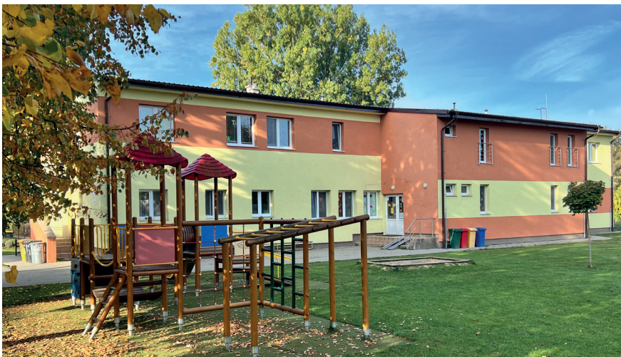
Rekonštrukcia materskej školy sa podarila aj vďaka dotáciám

- 230 480,74 € sme získali na rekonštrukciu a zariadenie MŠ 1, 213