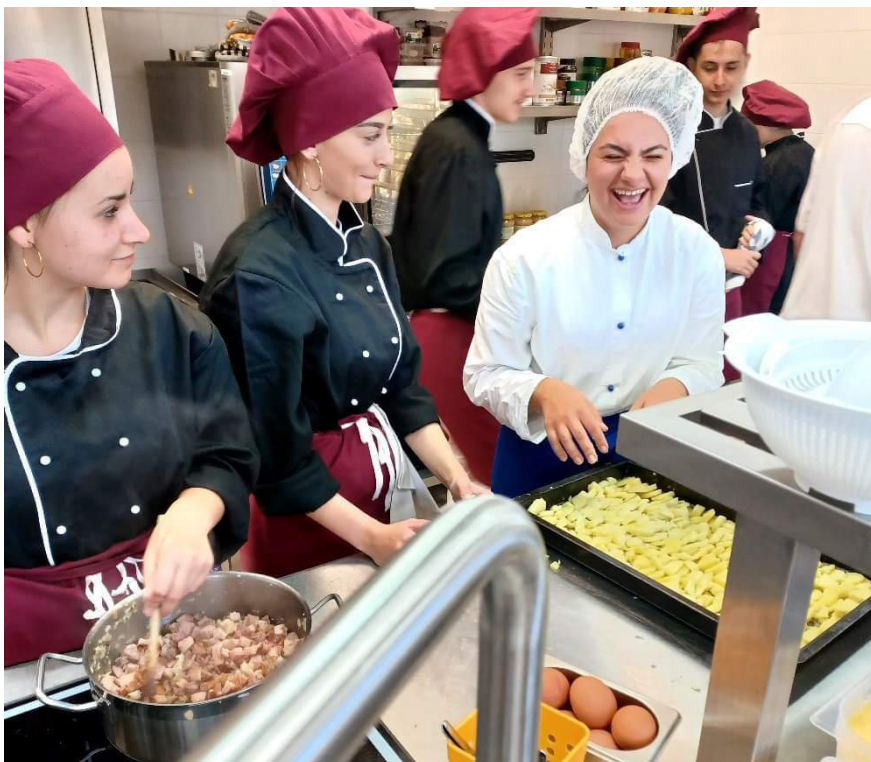
Príprava tradičných českých pokrmov zo zemiakov

VIDEOREPORTÁŽ Z VÝMENNÉHO POBYTU V BARDEJOVE NÁJDETE NA YOUTUBE KANÁLI AHOJ.TV