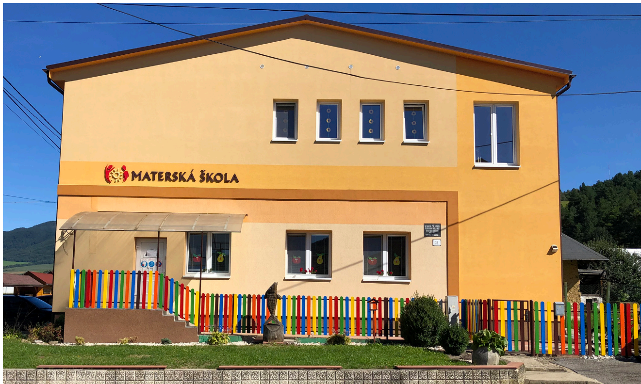
Materská škola vo Sveržove

Záver kalendárneho roka sa nesie už tradične v znamení bilancii. Ani my sa nechceme spreneveriť tradíciám a zvlášť nie v tomto roku, ktorý možno označiť za zvláštny.