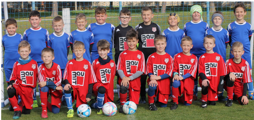
! Mladí futbalisti z Bardejova

Súťaž je organizovaná SFZ a je rozdelená na skupiny podľa regiónov. Ani tu ešte výsled-