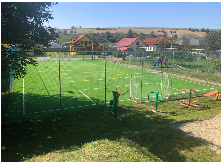
Ihrisko pri základnej škole sa teší veľkej obľube

ZAÚJÍMAVÉ VIDEOREPORTÁŽE ZO SVERŽOVA NÁJDETE NA YOUTUBE KANÁLI AHOJ.TV