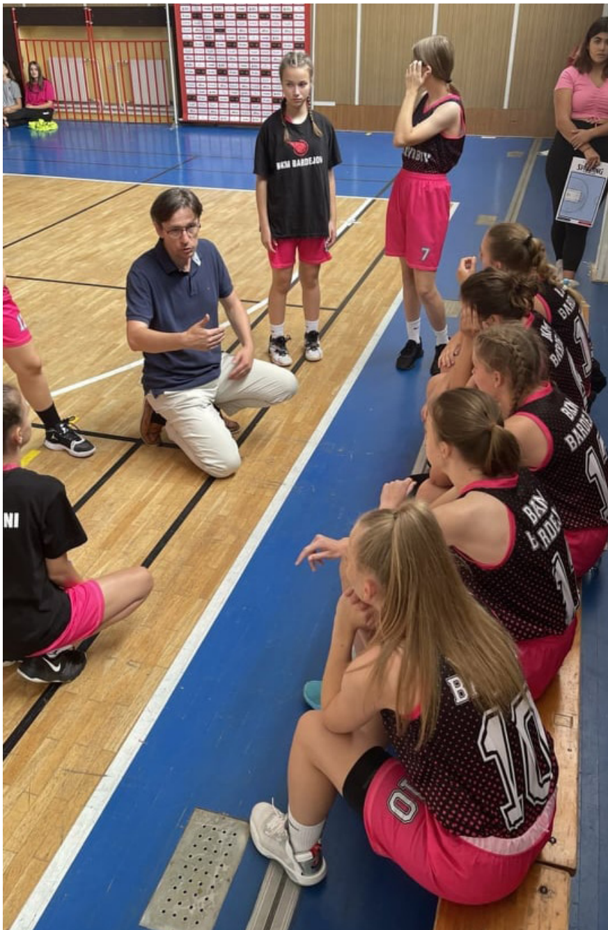
I Dievčatá potrebujú usmerniť a povzbudiť

Práca trénera mládeže je len sčasti o viditeľných úspechoch na ihrisku. Oveľa dôležitejšie výsledky pri práci s mládežou