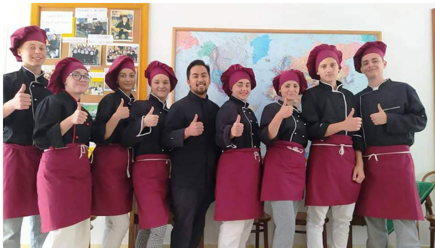
Študentský tím na výmennom pobyte v českej Novej Páke

Vďaka programu Erasmus+ sa žiaci a učitelia našej školy – Strednej odbornej školy ekonomiky, hotelierstva a služieb Jána Andraščíka v Bardejove zapojili spolu s partnerskou školou Střední škola gastronomie a služeb v Novej Páke do projektu „Ukaž, co umíš“.